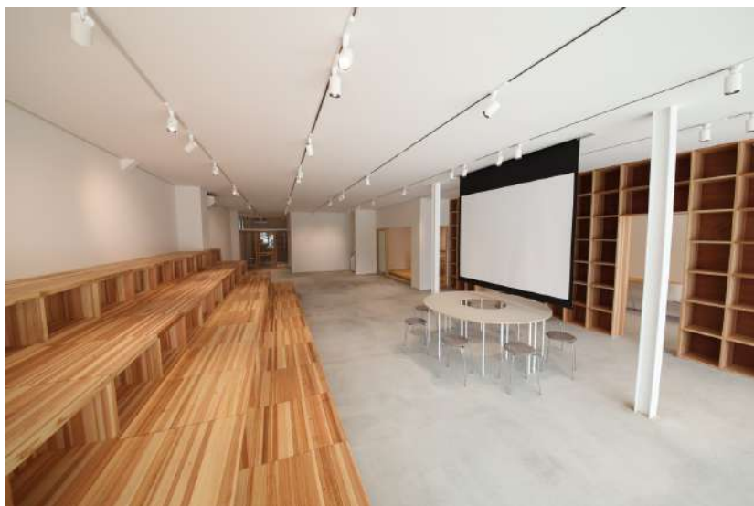
コミュニティスペース