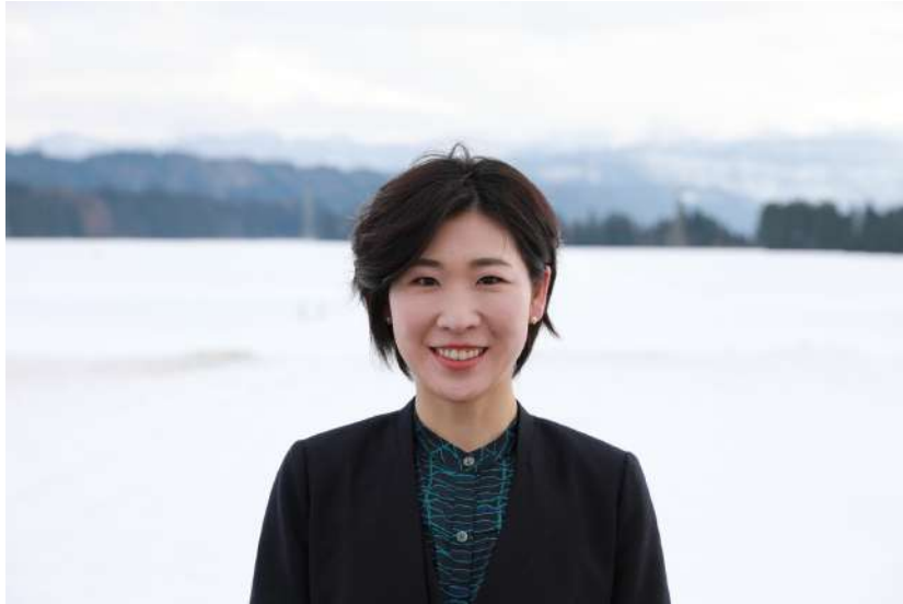
津南町長 桑原 悠 ※全国最年少女性町長